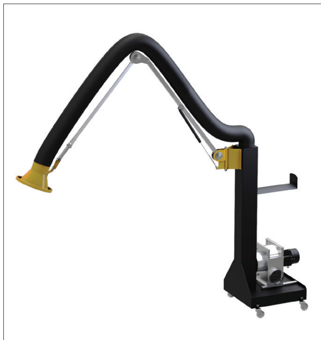
Mobilvogn med ASA arm

Sortlakeret stålkonstruktion med hjul og lavt tyngdepunkt. Højde (u.arm): 1700 mm